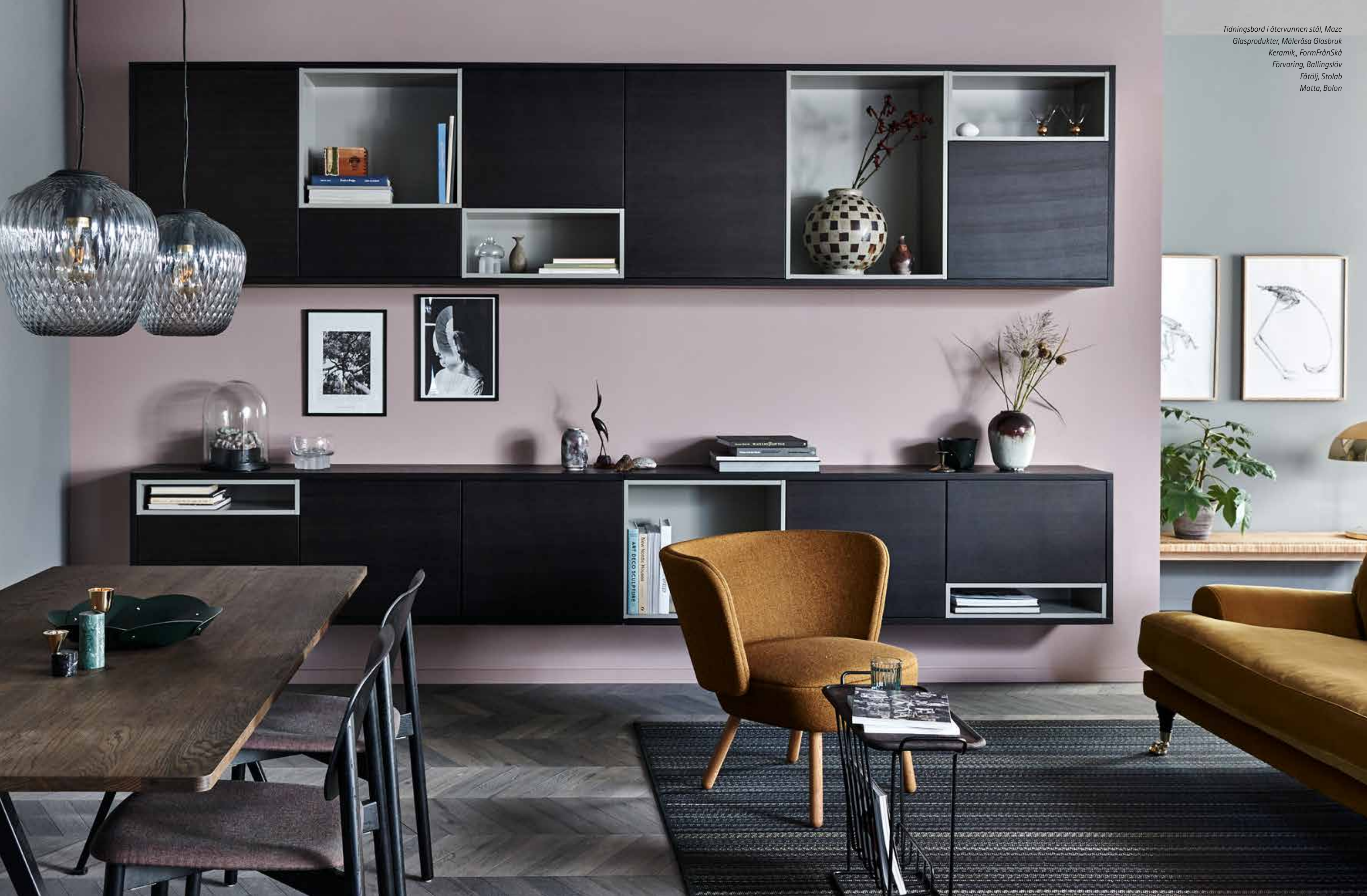
Tidningsbord i återvunnen stål, Maze Glasprodukter, Målerås Glasbruk Keramik, FormFrånSkå Förvaring, Ballingslöv Fåtölj, Stolab Matta, Bolon