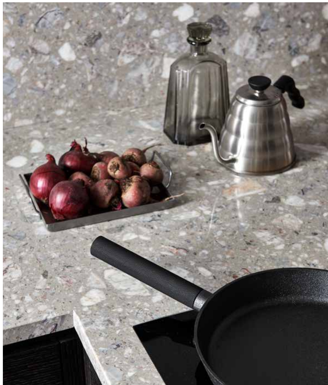
Den Skandinaviska stilen inom mode, inredning och design har länge likställts som avskalad formstark och minimalistisk. I framtiden kan även ett holistisk förhållningssätt till hållbarhet bli synonymt till begreppet..