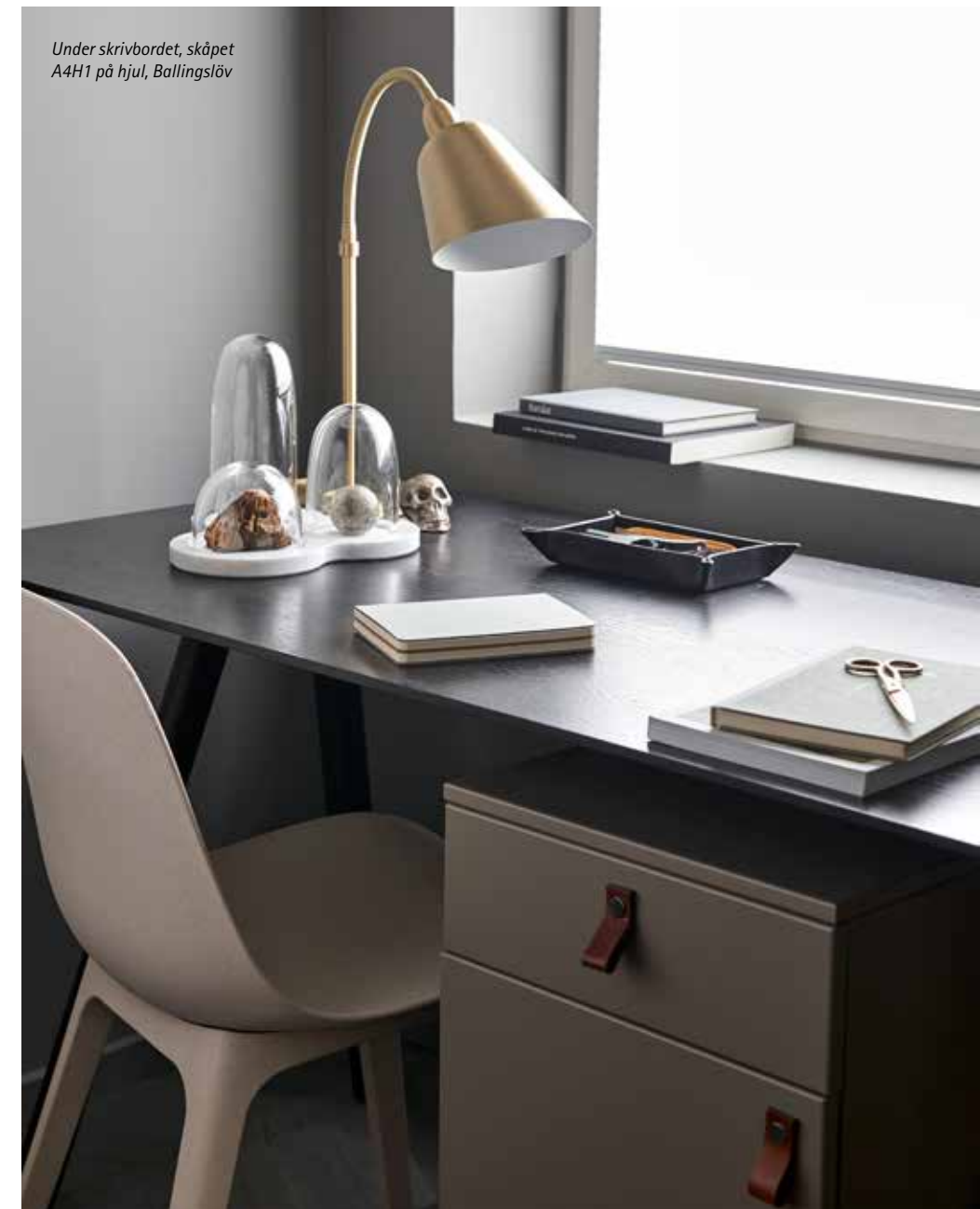
Under skrivbordet, skåpet A4H1 på hjul, Ballingslöv

Genom att välja ett sammanhållet formspråk i en öppen planlösning skapas en luftig känsla när de olika rummen spiller över i varandra. Möjligheten att låta möbler skifta plats med varandra när livet eller säsongen förändras ökar inredningens livslängd.